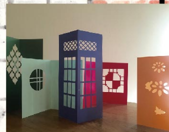
切り紙で楽しみましょう

🎯 対象者 ワークショップに参加希望の子ども及び保護者の方、ハサミ、カッターで紙を切りますので、これらを使える方