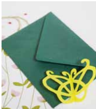
結び蝶は「お守りもんきり」より

めぐる季節に咲く花々がうれしい気分。 出掛けはなかなか叶わないけど、 お部屋に季節の紋を飾れば、ふっと明るい気分。 ちょっとしたお楽しみにもぴったり。